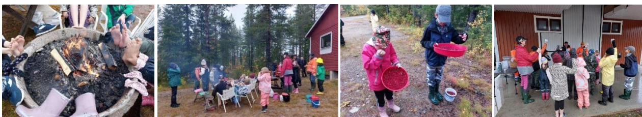
15 september skogsexkursion med åk 1-6 i Glommersträsk som tappert genomförde aktiviteterna i regn och rusk.