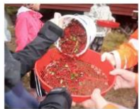
Days för rensning av bären.