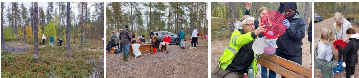
12, 13, 14 september skogsexkursion med åk 6 och åk 8 i Arvidsjaur. Eleverna plockade bär, provade att rensa bären, deltog i dialog om allemansrätt och bärplockning samt gick tipsrunda med frågor om allemansrätten.

Alla skogsaktiviteter inleddes med presentation av projektgrupp, kort återkoppling till vårens aktivitet och programmet för dagen. Under passet med bärplockning minglade projektgruppen runt och småpratade med de bärplockande eleverna. Spontana frågor ställdes om erfarenheter, upplevelse och synpunkter. Alla elever deltog också i en tipsrunda med frågor om allemansrätten.