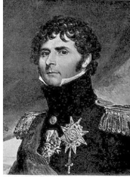
KARL XIV JOHAN Målning av F Gérard 1810, K slottet, Sthlm