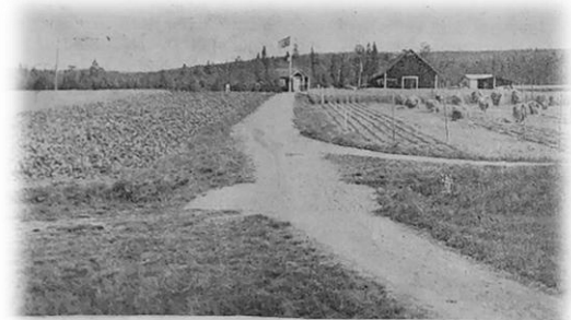
Statens Försöksgård i Brännberg